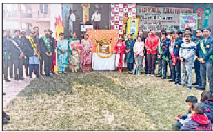
कार्यक्रम में उपस्थित विद्यार्थी एवं शिक्षक।