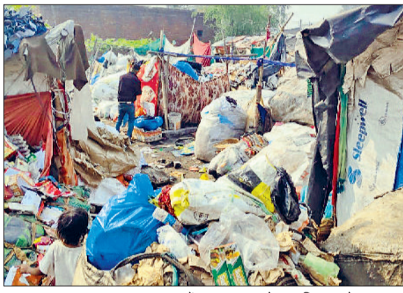
बहादुरगढ़। बहादुरगढ़। कृष्णा नगर में पकड़ा गया अवैध प्लास्टिक स्टोर।

■ 5 प्लास्टिक वॉशिंग यूनिट और 1 फेब्रिक बिना अनुमति के संचालित मिली