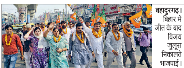
बहादुरगढ़। बिहार में जीत के बाद विजय जुलूस निकालते भाजपाई।