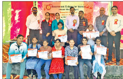
बहादुरगढ़। विजेता छात्रों के साथ कॉलेज प्रिंसिपल व स्टॉफ।