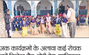
कार्यक्रम में उपस्थित विद्यार्थी एवं शिक्षक।