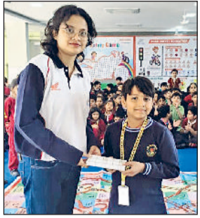
बहादुरगढ़। सही उतर देने वाले विद्यार्थी को पुरस्कृत करती हुई।