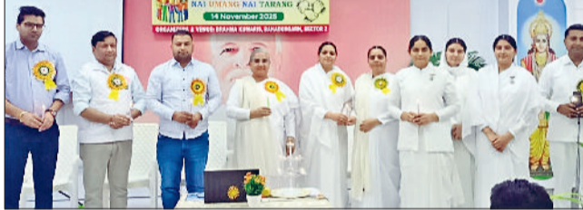
बहादुरगढ़। कंपनी के अधिकारियों के साथ ब्रह्माकुमारीय।

प्रजापिता ब्रह्माकुमारी ईश्वरीय विश्वविद्यालय के सेक्टर-2 सेवाकेंद्र में ब्रह्माकुमारीज के युवा प्रभाग द्वारा संचालित नई उमंग नई तरंग प्रोजेक्ट के अंतर्गत जिंदल लाइफस्टाइल लिमिटेड कंपनी के कर्मचारियों के लिए विशेष वर्कशॉप एवं सेमिनार का आयोजन किया गया। इसमें कंपनी के करीब 40 अधिकारी एवं कर्मचारी उपस्थित रहे। कार्यक्रम में टीम स्पिरिट को सहजता से समझाने के लिए विभिन्न अमूर्त गतिविधियों, इंटरएक्टिव वर्कशॉप और मोटिवेशनल एक्सरसाइज कराई गईं। कार्यक्रम की शुरुआत सेवाकेंद्र