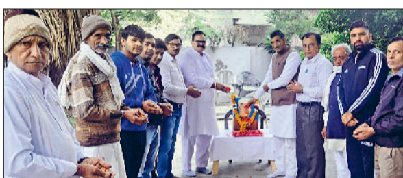
बहादुरगढ़। पंडित नेहरू को जयंती पर श्रद्धांजलि देते कांग्रेसी।