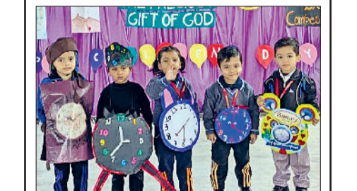
बहादुरगढ़। सिल्वर बेल्ल स्कूल में बाल दिवस के उपलक्ष्य में बच्चों द्वारा फैसी ड्रेस प्रतियोगिता में लिया भाग।