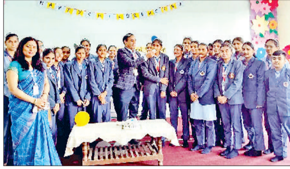
झज्जर। कार्यक्रम के दौरान विजयी चिन्ह बनाते हुए विजेता प्रतिभागी।