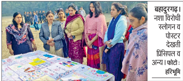
बहादुरगढ़। नशा विरोधी स्लोगन व पोस्टर देखाती प्रिंसिपल व अन्य।