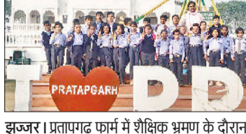
झज्जर। प्रतापगढ़ फार्म में शैक्षिक भ्रमण के दौरान उपस्थित शिक्षक एवं विद्यार्थी।