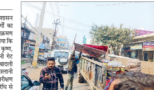
झज्जर। दुकानों बाहर रखे होड़ों को ट्राली में डालते हुए नए कर्मचारी।