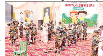
झज्जर। देशभक्ति गीत पर नृत्य की प्रस्तुति देते हुए नव्हे विद्यार्थी।