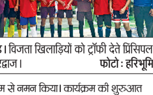
बहादुरगढ़। विजेता खिलाड़ियों को ट्रॉफी देते प्रिंसिपल शिक्षा के प्रति जागरूकता फैलाने की उनकी सोच को विद्यालय ने विशेष कार्यक्रमों के माध्यम से नमन किया।