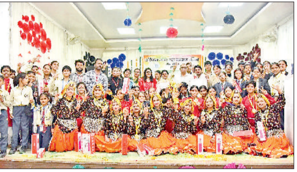
झज्जर। कार्यक्रम के दौरान विजयी चिन्ह बनाते हुए विजेता प्रतिभागी।