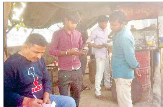
झज्जर। प्रदूषण फैलाने के संबंध में दुकानदारों का चालान करते हुए टीम।