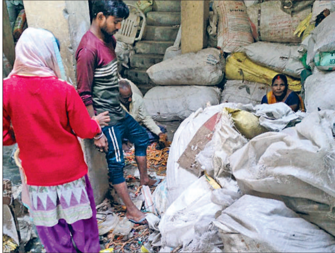
बहादुरगढ़। लाइनपर में पकड़ी गई अवैध प्लास्टिक प्रोसेसिंग यूनिट।

शुक्रवार को एचएसपीसीबी के एसडीओ ने सिंचाई विभाग विभाग के एसडीओ, नगर परिषद के पालिका अभियंता, बीएंडआर के जेई, यूएबीवीएन लाइनमैन और पुलिस विभाग की संयुक्त टीम के साथ निरीक्षण किया।