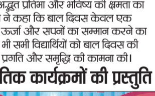
कार्यक्रमों की प्रस्तुति देने वाली छात्राएं।