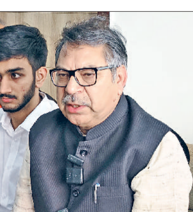
बहादुरगढ़। पत्रकारों से बात करते भाजपा प्रमारी सतीश पुनिया।