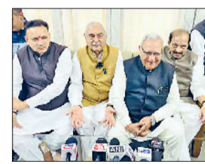
झज्जर। पत्रकार वार्ता करती पूर्व मुख्यमंत्री भूपेंद्र सिंह हुड्डा।

ज्ञापन में भारी बारिश से किसानों को हुए नुकसान, धान की खरीद में हुए घोटाले, प्रदेश में बढ़ते अपराध और राशन कार्ड घोटाले पर संज्ञान लेने की मांग की गई। उन्होंने कहा कि पिछले दिनों प्रदेशभर में हुई